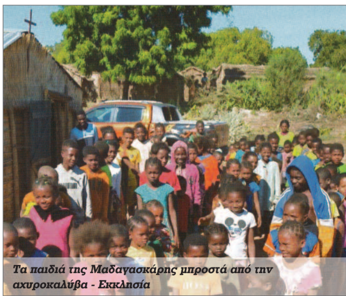
Τα παιδιά της Μαδαγασκάρης μπροστά από την ακυροκαλύβα - Εκκλησία

Από την ακολουθία θεμελίωσης του Ιερού Ναού της Αγίας Τριάδος