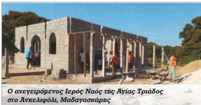
Ο ανεγειρόμενος Ιερός Ναός της Αγίας Τριάδος στο Ανκελιφόλι, Μαδαγασκάρης